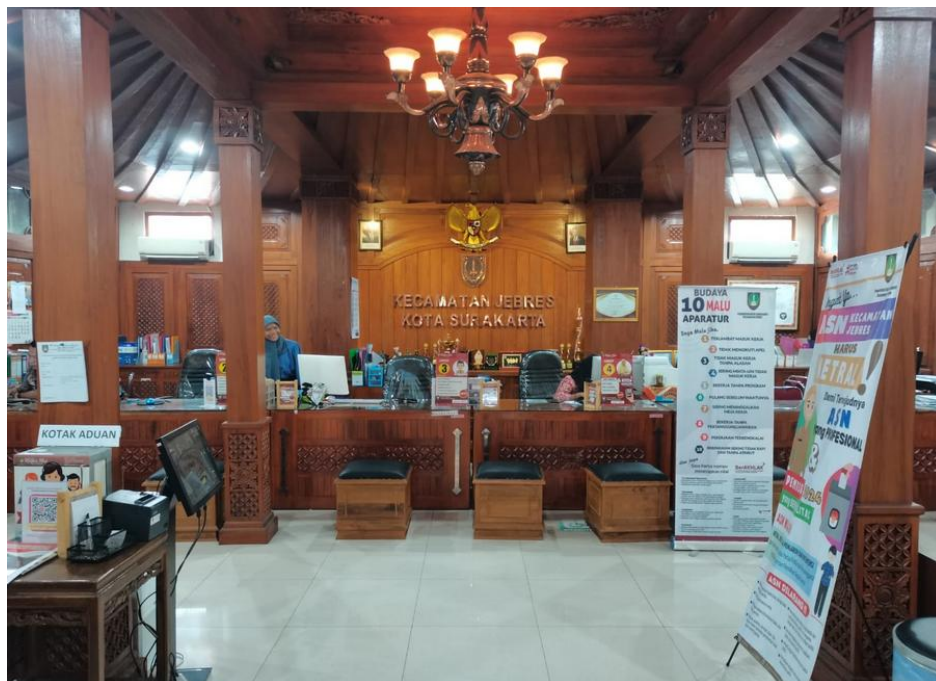
Gambar 2.1 Ruang Pelayanan Kantor Kecamatan Jebres

Operasional layanan informasi publik dilaksanakan setiap hari senin s.d. kamis pukul 08.00 s/d 16.00 WIB dan hari jumat pukul 08.00 s/d 14.00 WIB. Namun, di luar jam kerja tersebut masih dimungkinkan bagi pemohon informasi untuk menggunakan haknya dengan berbagai sarana media komunikasi yang ada tanpa harus datang langsung ke kantor Kecamatan Jebres Kota Surakarta, seperti email dan permintaan online melalui website maupun media sosial seperti Instagram.